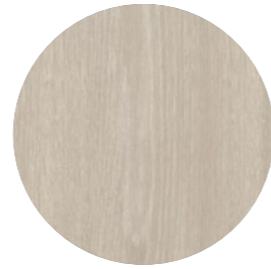
chêne platine Legnato Ei 424 Page 06