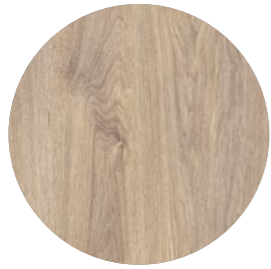
chêne adria Innato EI 767 Page 04