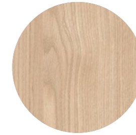
chêne élégance Estria Ei 342 Page 08