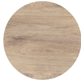
chêne adria cross Innato Cross EIC 767 Page 05