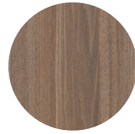
noyer savoia Alevé AP 4604 Page 15