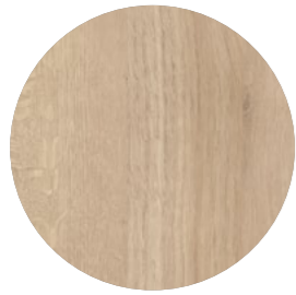
lago chêne clair Sentira Ei 320 Page 10