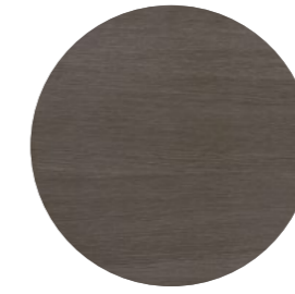
pin gris Innato Cross PIC 44 Page 14