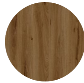
chêne gravis Robur Ei 377 Page 18