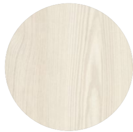
mélèze nordique Selva KIP 234 Page 11