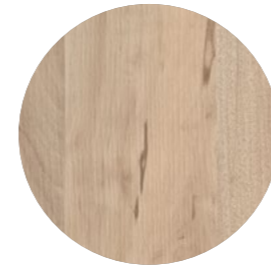
cerisier avola Alevé AP 4605 Page 07