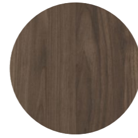
noyer torino Selva NU 731 Page 13