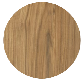
chêne montanus Selva Ei 797 Page 17