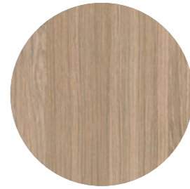
chêne chalet beige Sentira Ei 357 Page 09