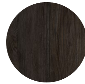
chêne des marais Innato MEi 170 Page 19