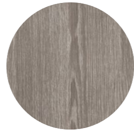
chêne fumé Alevé AP 4511 Page 12