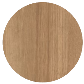
chêne lago foncé Sentira EiL 730 Page 16